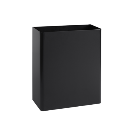
ODPADKOVÝ KOŠ, 26,5L, ZÁVĚSNÝ ČERNÝ MAT