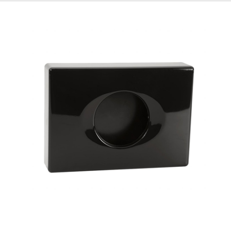
ZÁSOBNÍK HYGIENICKÝCH SÁČKŮ, ČERNÝ