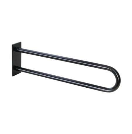
PODPĚRNÉ MADLO VE TVARU U S KRYTKOU, 813 MM, ČERNÉ