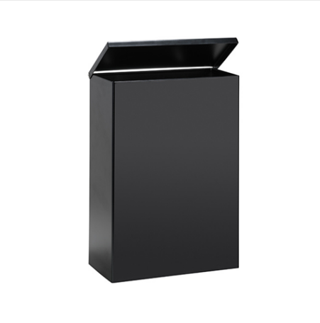
ODPADKOVÝ KOŠ, 6L, ZÁVĚSNÝ, S POKLOPEM, ČERNÝ MAT