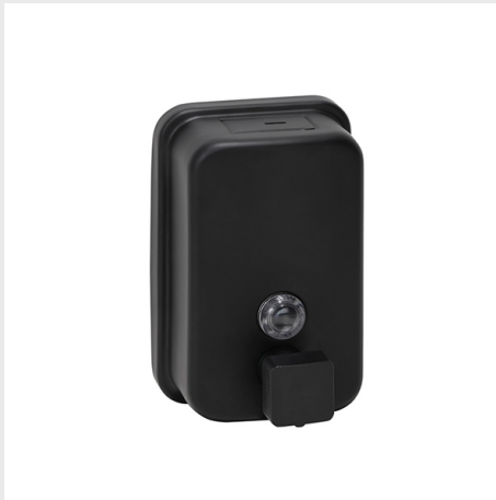
DÁVKOVAČ MÝDLA, 500ML, NEREZ, ČERNÝ