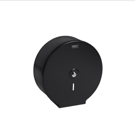
ZÁSOBNÍK NA TOALETNÍ PAPÍR 290MM, ČERNÝ MAT