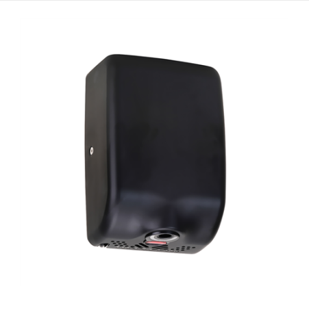
BEZDOTYKOVÝ OSOUŠEČ RUKOU, 1000W, NEREZ, ČERNÝ