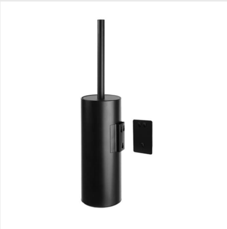
WC KARTÁČ S DRŽÁKEM 350MM, ČERNÝ MAT